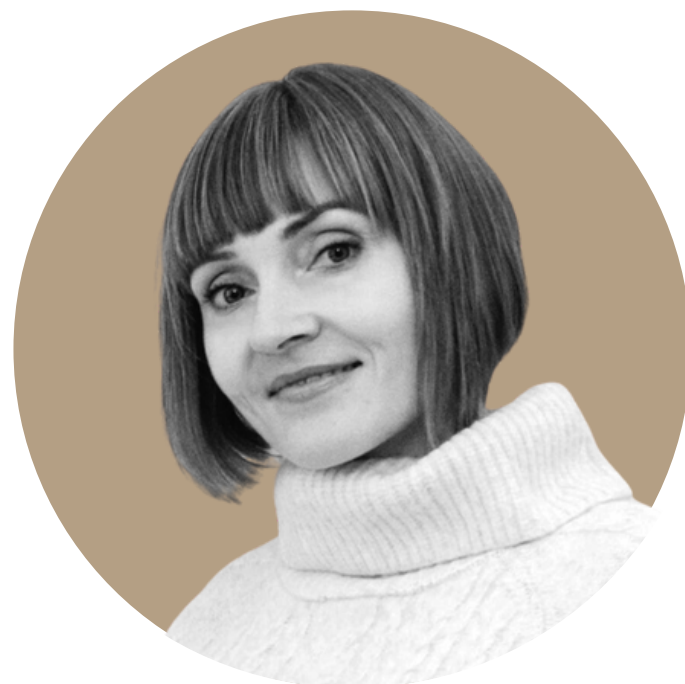
Anna Ćwiklińska opracowanie merytoryczne