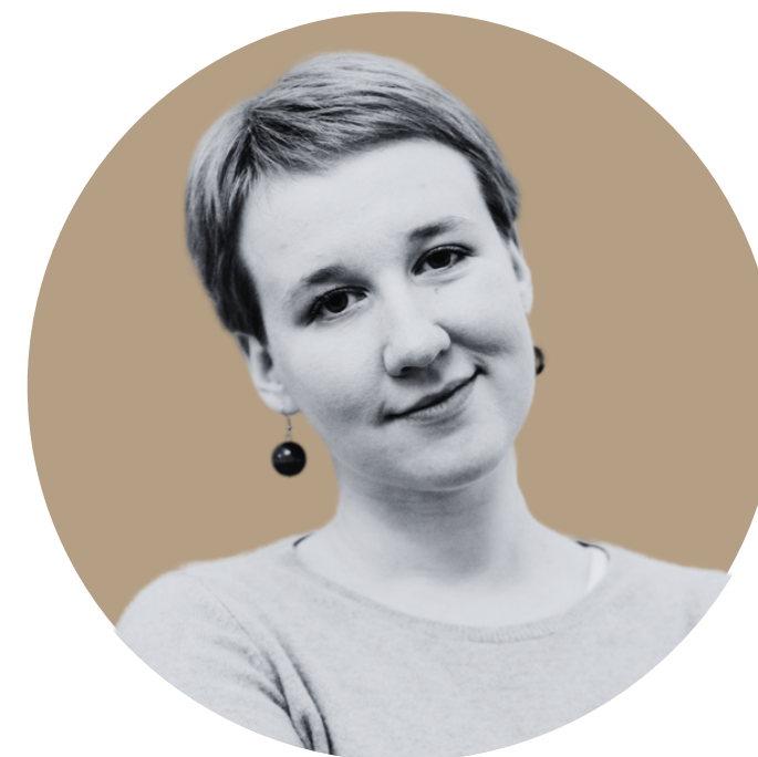
Katarzyna Rynkowska opracowanie merytoryczne opracowanie graficzne