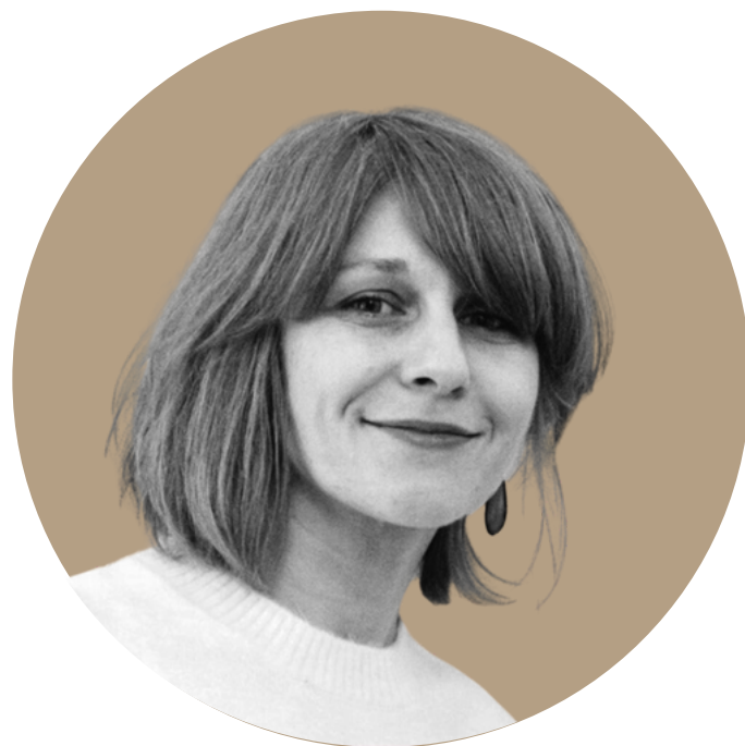
Wioletta Szuba opracowanie merytoryczne